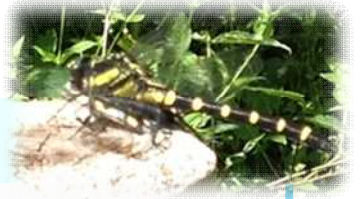
しっち 湿地：コオニヤンマ など