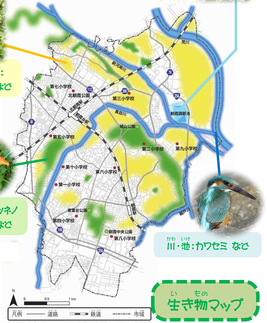
いもの 生き物マップ