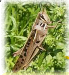
くさちのうち 草地・農地： ツチイナゴ など