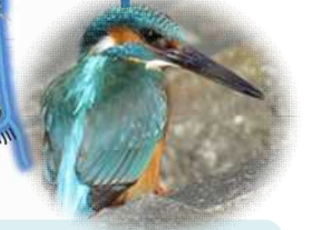
かわ いけ 川・池：かわせみ など