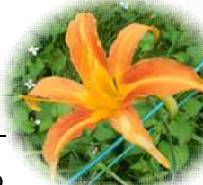
じゅりんち 樹林地：キツネノ カミハリ など