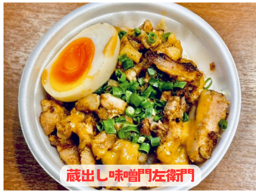
蔵出し味噌門左衛門

各店の人気メニューを、創業50年の「麻婆豆腐」の5つの味（麻→痺れ、辣→辛味、甜→甘味、鹹→塩味、酸→酸味）が混ざり合い生まれる美味しさを是非お楽しみ下さい！