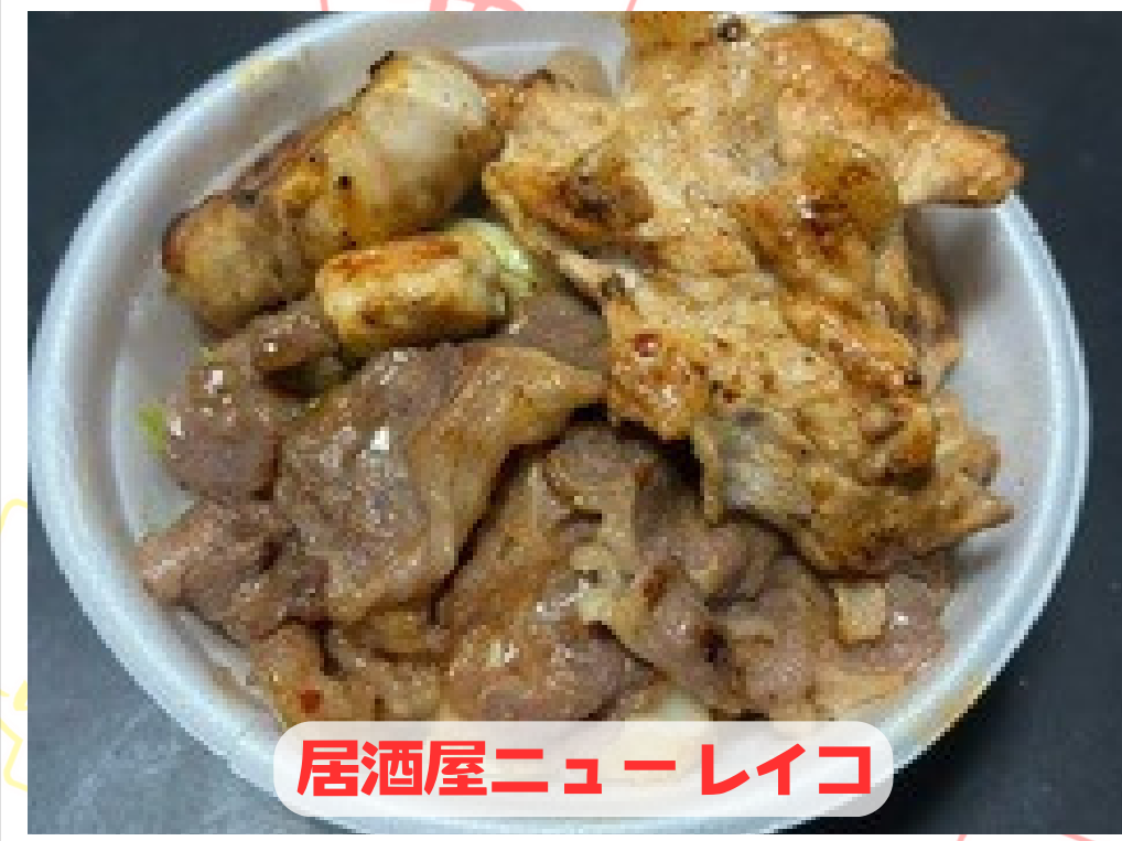
居酒屋ニューレイコ

この丼は、豚肉、鶏肉、牛肉、鶏肉をMIXなど、まぜ混ぜた味で、子供から大人まで、お楽しみください！