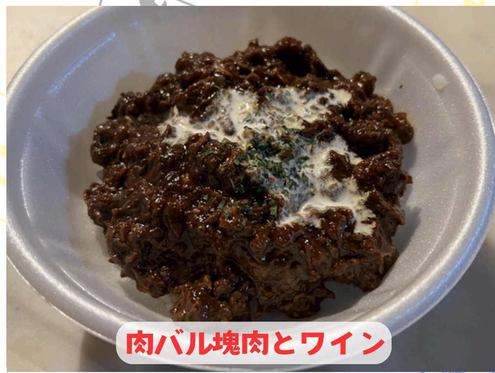
肉バル塊肉とワイン

濃厚なデミグラスでじっくり煮込んだ牛スジはとろっと柔らかく深い味わいに仕上がっております！ワインと一緒にご堪能下さい！