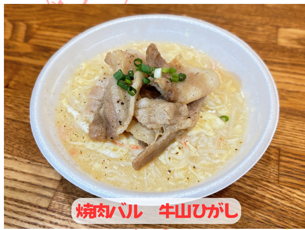
焼肉バル 牛山ひがし