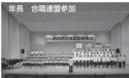
合唱連盟演奏会へ参加