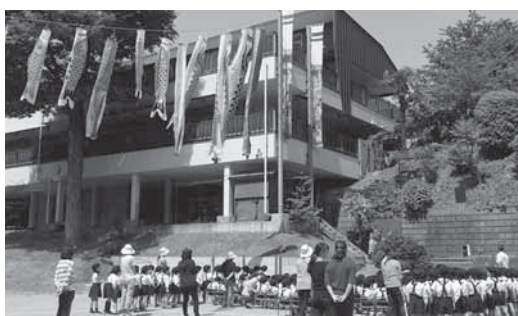
園庭から見た園舎

豊かな自然の中、蝶や虫を追いかける子どもたち。グラウンドを走り回り、サッカーに興じる子どもたち、ここが子どもたちのワンダーランドであって欲しいと願っています。樹齢100年を超えるであろうゼルコバをシンボルツリーに、歌声が流れ、笑顔のあふれる子どもたちの園。