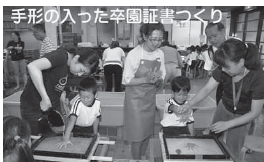
手すき和紙による証書作り