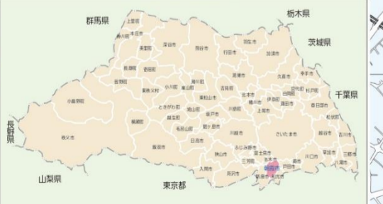
朝霞市の位置 (平成29年4月1日現在)