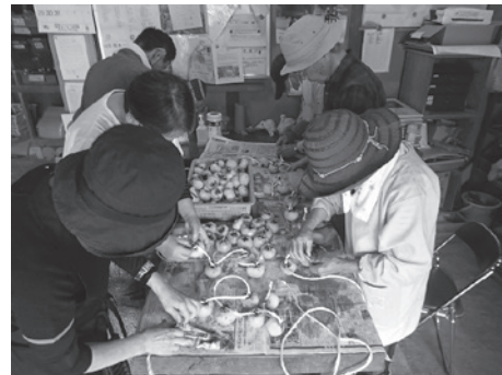
つるし柿を作っている様子（秋）