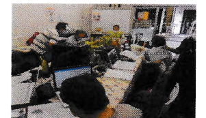
シニアパソコンレッスン