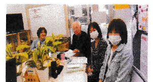
シニア脳活英会話