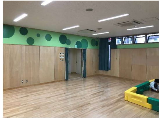
朝霞市「ほんちょう児童館」(屋内遊戯場)