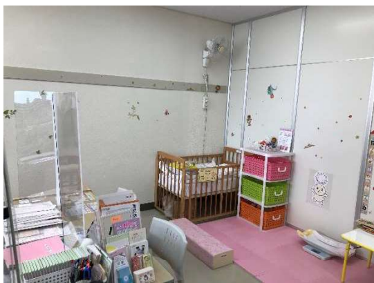
朝霞市「保健センター」(現在の子育て世代包括支援センター)