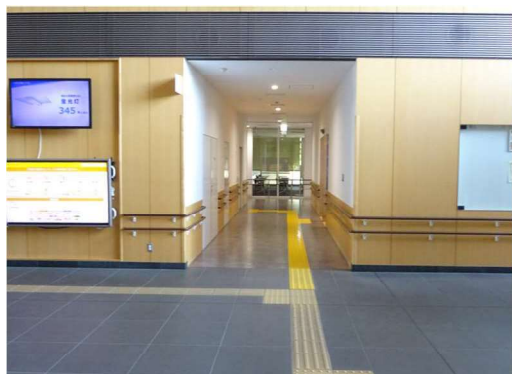
（事例）所沢市こどもと福祉の未来館（誘導ブロック・大型モニター）