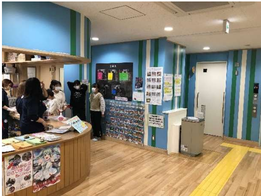
朝霞市「ほんちょう児童館」(受付案内)