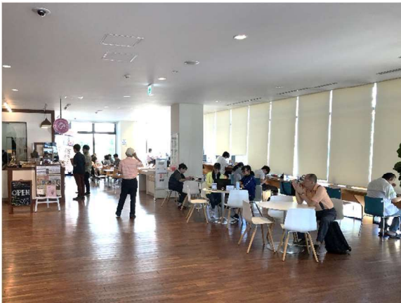
（事例）本庄市「市民活動交流センター」