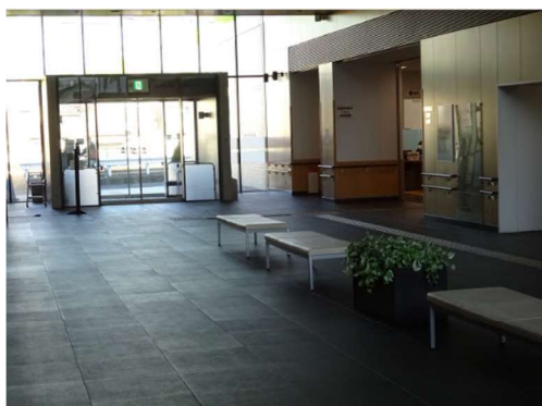
（事例）所沢市「こどもと福祉の未来館」開放的なロビー