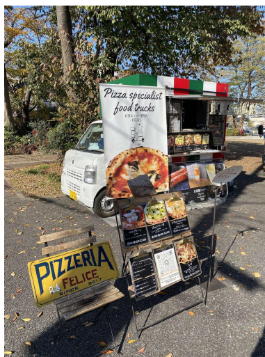
(事例) 朝霞市にぎわい創出実証実験の様子(小さなテラスでのキッチンカー)