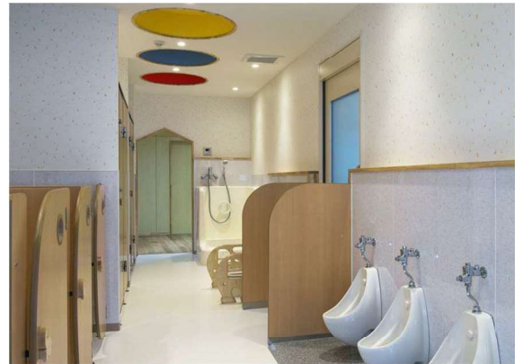
(事例) 子ども用トイレ