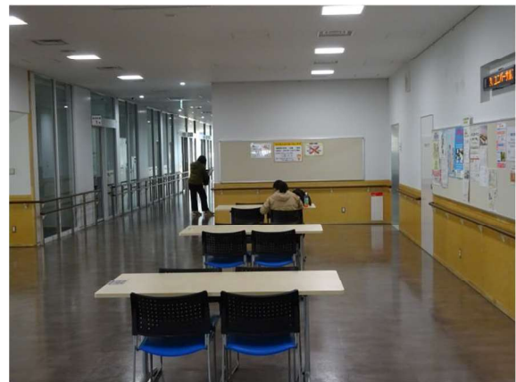
（事例）所沢市「こどもと福祉の未来館」世代間交流広場