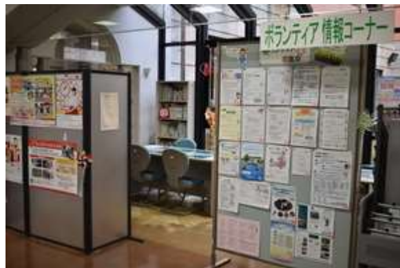
朝霞市「はあとびあ」(ボランティア情報コーナー)