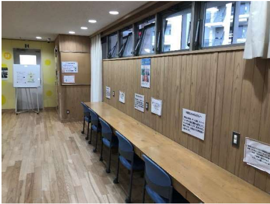
朝霞市「ほんちょう児童館」(中高生の居場所:自習スペース)