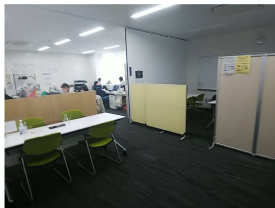
(事例) 所沢市「こどもと福祉の未来館」福祉相談窓口カウンター (事例) 杉並区「ウェルファーム杉並」基幹相談支援センター