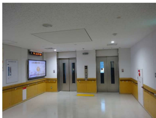
（事例）ベビーカーや車いすも乗り降りしやすく安全なエレベーター