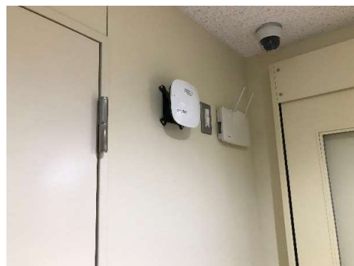
朝霞市「ほんちょう児童館」（Wi-Fi 設備・監視カメラ）