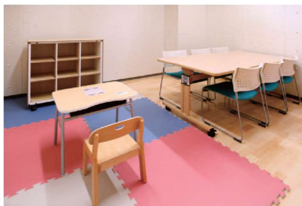
(事例) 所沢市「こどもと福祉の未来館」こども支援センター