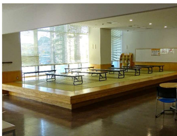
(事例) 所沢市「こどもと福祉の未来館」畳敷小上がりスペース