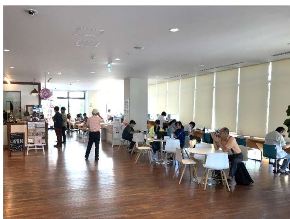
(事例) 本庄市「市民活動交流センター」