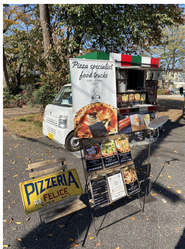
(事例) 朝霞市にぎわい創出実証実験の様子(小さなテラスでのキッチンカー)