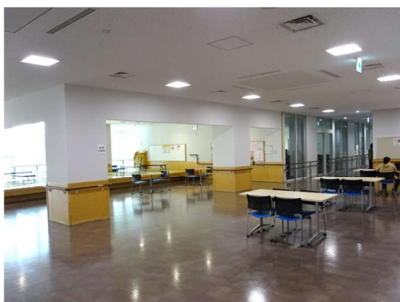
(事例) 所沢市「こどもと福祉の未来館」世代間交流広場