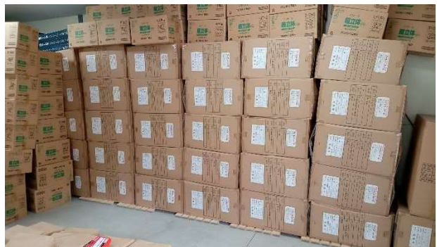
朝霞市内 防災倉庫の収納物