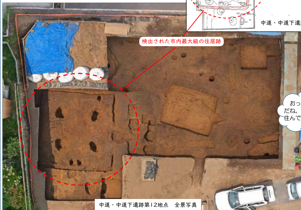
中道・中道下遺跡第12地点 全景写真