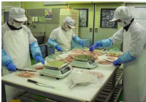
株式会社アンデス (上)作業場 (下)履物消毒マット