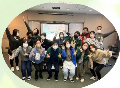
▲リアル脱出ゲームで交流を深めました

市町村ごとに特色 あるイベントを 企画し、1年を通し、様々な 活動をしています。