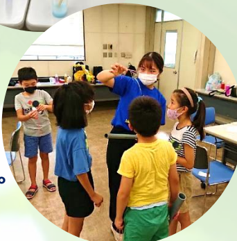
▲身近なもので科学実験

アウトドアのほかにも、 子供たちと一緒に お菓子作りや 科学実験、工作体験、 クリスマス会など、 様々な催しを行います。