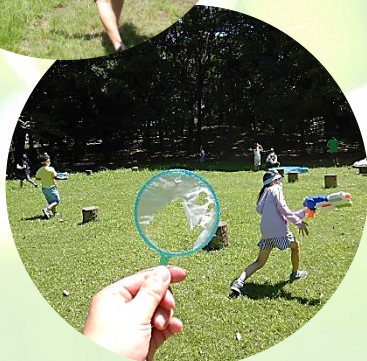
▲ウォーターサバイバルゲーム

夏に恒例の ウォーター サバイバルゲーム を開催! 年々パワーアップ しています!