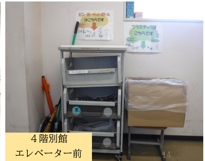
4階別館 エレベーター前