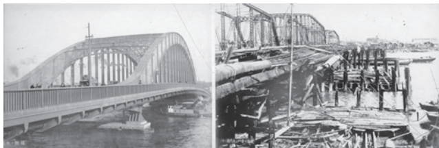
永代橋(左：復興後、右：震災時)『復興』昭和5年(東京都発行)

令和5(2023)年、大正12(1923)年9月1日に発生した関東大震災から100年を迎えました。当時を経験された方も少なくなり、記憶も薄れつつある今、館蔵資料により当時を振り返るとともに、朝霞市域の地震の歴史と、現在の朝霞市の対策などについて紹介します。