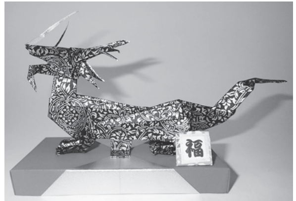
（原作者：麻生玲子さん）

申／12月20日(水)【必着】までに、往復はがきで住所・氏名（ふりがな）・年齢・電話番号・「おりがみで干支を折ろう！」・希望時間を記入し、朝霞市博物館宛に郵送 ※返信欄にも住所・氏名を記入してください。1枚のはがきで参加者1人のみ申込可