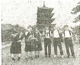
3年修学旅行 興福寺

2学期は、すでに実施した3年修学旅行や1年川越校外学習、そして生徒会役員改選をはじめ、新人戦、合唱コンクール、駅伝大会、中間テスト、期末テストなど、たくさんの行事があります。夢や目標を見失うことなく、「今やるべきことは何か」、「今できることは何か」など将来を見つめて行動し、 実りの秋にふさわしい躍動的なステップ を実現してほしいと思います。