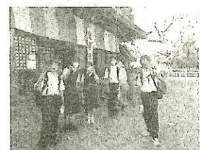
1年川越校外学習 喜多院