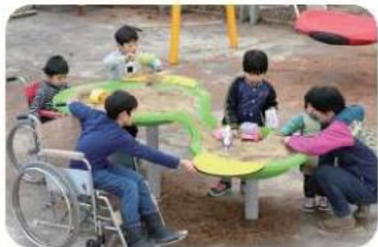
車いすでも遊べる砂場