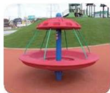
車いすでも遊べる回転遊具