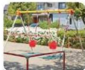
インクルーシブブランコ