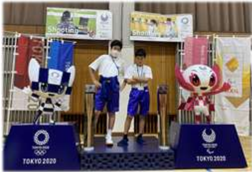
特別支援学級 6組 (6月)