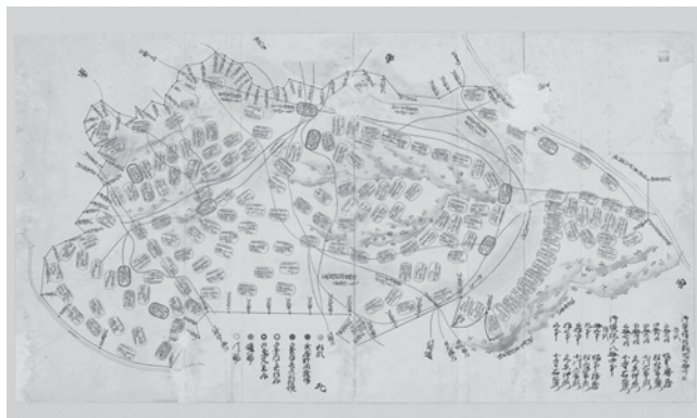
尾張家御鷹場絵図

近世から現代にかけての朝霞の絵図・地図を紹介します。その年代をさかのぼれば、地域の歴史が浮かび上がってきます。展示を通じて、朝霞の移り変わりに思いをはせてみませんか？