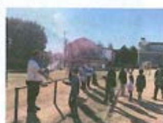
【オールスターラリー】