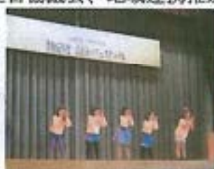
【ふれあいフェスティバル】