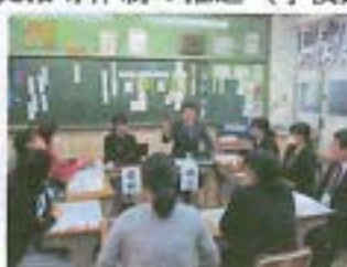
【小中連携推進事業】