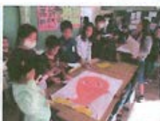
【二小フェスティバル】