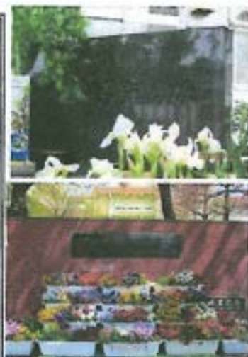
【「開校百年の碑」と「古墳」】

明治6年に「岡小学校」として創立した本校は、移転や改称を経て、昨年度開校150年目を迎えた市内で最も歴史と伝統のある学校である。朝霞市の東部、台地の部分に位置し、学区は南北に長く、坂を下った北側には豊かな水の流れに水鳥が遊ぶ黒目川が控えている。その川の近くには南北朝時代の城跡といわれる「城山」がある。はるか西方には富士山が望め、穏やかで落ち着いた場所である。また、県南部で発見された最大の古墳と言われる終塚古墳、体育館周辺にあった一夜塚古墳、向山地区周辺からは多くの遺跡が発見されるなど、古くから朝霞市の中心的地域だったと考えられている。さらに、新編武蔵風土記に古来からあったとされる東圓寺や、江戸時代中期建築と推定される貴重な旧高橋家住宅など歴史的建造物も身近で見ることができる。このような豊かな自然や文化財に恵まれた環境を十分に生かした特色ある教育課程を編成し、質の高い教育活動を展開する。