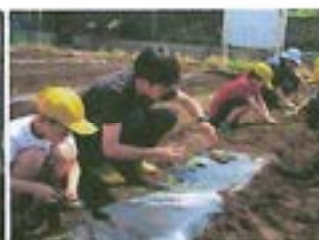
【サツマイモの苗植え】