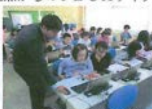
【プログラミング教育】