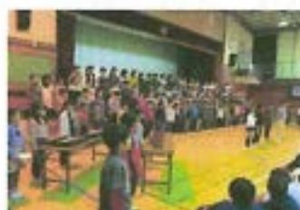
【音楽集会学年発表】