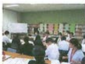
【指導者招聘研究協議】