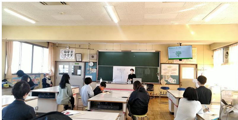
食育で家族の健康づくり！