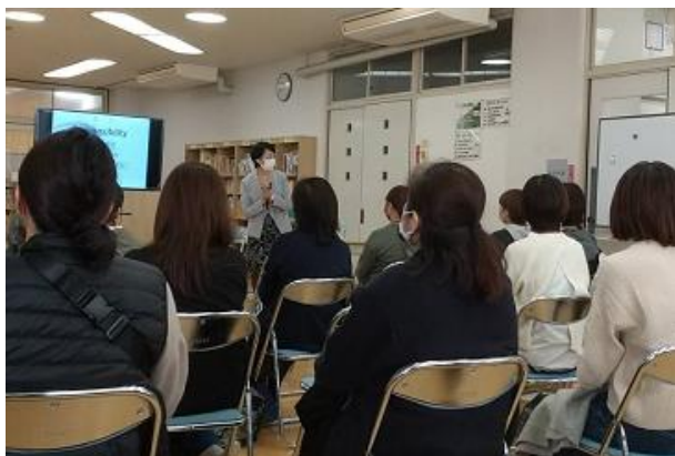
ハートフルな講義に聞き入る参加者

内容/子供の「生きる力」を开花させ、その子らしい幸せな自立を、どうサポートしたら良いかを学ぶ。