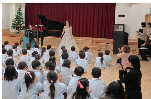
親子で楽しく学び、共感したひととき…

内容/クリスマスの伝統や聖歌、オペラについて知識を深め、子供たちと一緒に生の演奏やオペラを聴くことで、豊かな心と感性を育む時間を共有する。