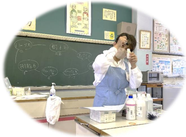
アロマスプレーとマスクシール作成の実演!

内容/アロマの効能と役割について知り、 免疫力を高めたり疲れた身体を整えるなど、 家族の体調に合わせた使い方を学ぶ。