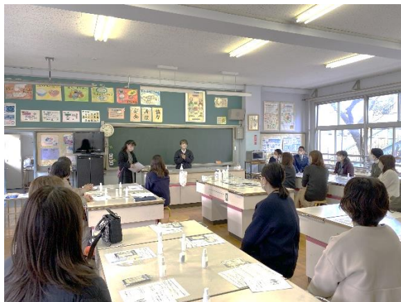
アロマの効能に興味津々の参加者