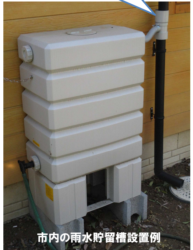
市内の雨水貯留槽設置例