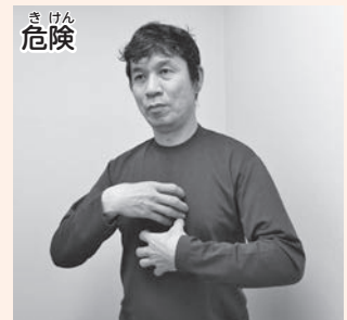
両手の指を軽く曲げ、胸に2回当てます。