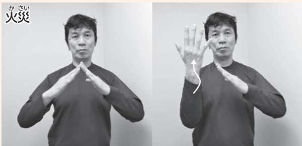
両手で家の形を作り、片方の手を内側にひねりながら上にあげます。