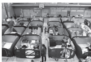
(対策後) 間仕切りテントを使用した避難所