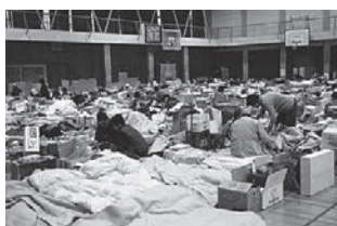
(対策前) 混雑した避難所