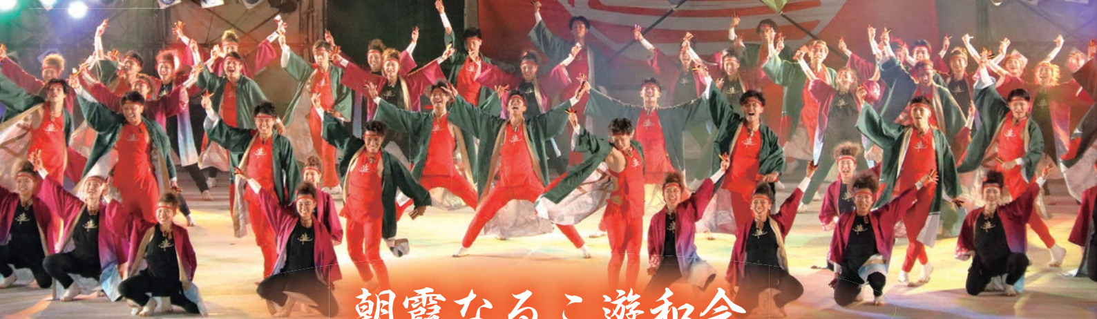
朝霞なるこ遊和会