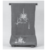
埼玉県美術家協会賞