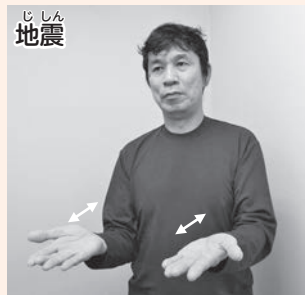
手の平を上に向け、両手を同時に前後させます。