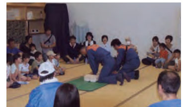
▲心肺蘇生法講習。子どもたちの真剣な眼差しが頼もしい。

また、町内会館は現在コロナ禍のため入館を制限していますが、コロナ感染症が終息し次第、地域のコミュニティの拠点として積極的に活用し、親睦を一層深めてまいりたいと思っています。これからも東南部町内会として、希望に満ちた輝く未来のために明るい街づくりに邁進してまいります。