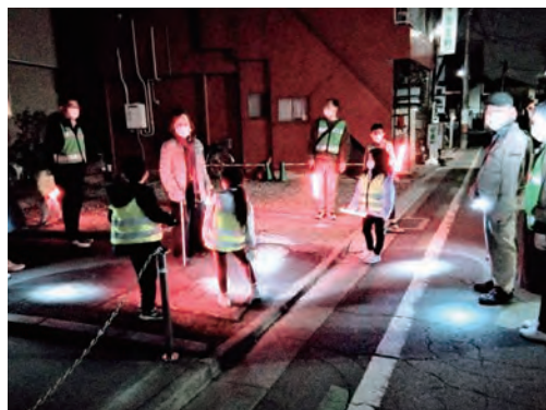
▲ぼくたち・わたしたちもまちの安全を見守ります。

一方で、新しく転入されてきた方の、地域に根付く生活をされていく中で成長していく「ちびっこ」達への支援と参加依頼があります。中止行事が多くなりました昨今ですが、例年どおりの「一斉清掃」、「防犯パトロール」に積極的に参加してくれています。「一斉清掃」時、会では「ごほうびのおやつ」を用意しています。多くの「ちびっこ」が公園の雑草取り、枯れ葉集めなどを手伝ってくれています。夜はパパ・ママと一緒にLED防犯警棒とチョッキを着て「地域探偵団」です。ちびっこ達の声が、これからの浜崎親交会の支えになってくれるでしょう。