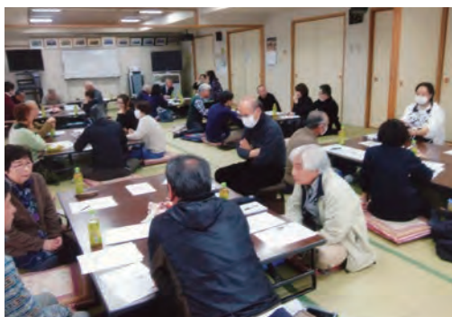
▲班長会議は、日頃の意見を出し合い学び合う大切な場です。

宮戸町内会の区域は1区～9区に分かれており、その中に班は143あります（令和3年度）。班長は、住民のみなさんに一番近くで接している存在です。例えば回覧板を回したり、町内会費や各種募金の集金など、また、班に一人暮らしの高齢者がいたり、子どもが一人で留守番をしていたり、そういう家庭があれば声掛けや見守りをされています。さらに、ゴミの集積や防犯灯、クリーンデーなど班内の環境・美化などにも目配り気配りしていただいております。ですから、班のまとめ役として日頃から様々な意見や要望をお持ちです。