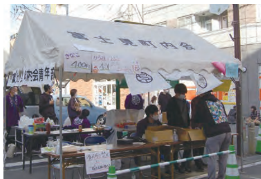
▲アサカストリートテラス出店の様子

そのほか、区域内に設置している約130の防犯灯を、町内会費用や市の補助金によりLED化し、防犯対策の強化に取組みました。これからも地域活動を通して、安心で活気あるまちづくりを目指して行きたいと思えます。