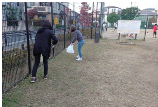
▲子どもたちの笑顔のために、みんなで清掃頑張っています。

新型コロナウイルスの終息が分からない状況ではありますが、これからも町内の美化活動を続けていきたいと思っております。