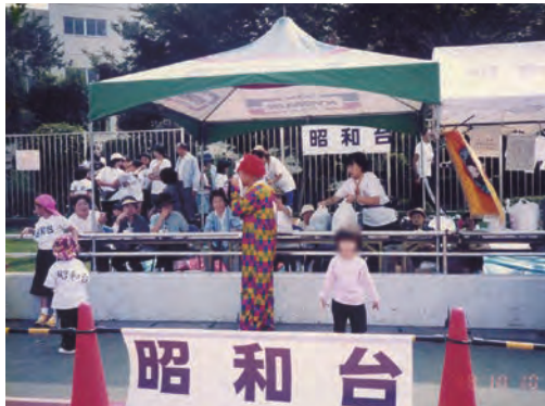
▲盛り上がっていた以前の体育祭の様子

当町内会では、市民体育祭への出場が1年を通して最大のイベントです。体育祭は町内会全体として参加し、全種目に出場します。大会前は集まって何度も練習をし、大会後の打ち上げも大盛り上がりで、イベントをとおして住民同士の親睦を深めています。