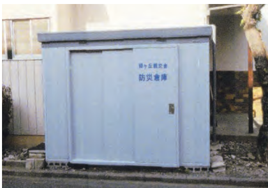
▲新しくなった防災倉庫。縁の下の力持ちです。

昭和24年に発足、今年73年目を迎え、世帯数は692戸（前年比102%）です。昭和15年陸軍被服廠の倉庫が東京赤羽から朝霞に移転するのに伴い、昭和16年住宅公団が288戸の住宅を建設したのが、緑ヶ丘の始まりです。