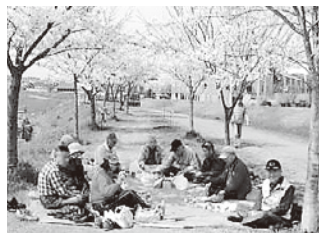
植樹した桜のお花見