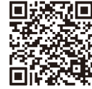
混雑緩和に関する情報