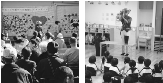
高齢者施設、児童施設でのバルーンアート事業