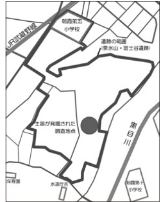
土器が発掘された調査地点

さらに、土器の文様のつけ方や使い方、また、市内の縄文時代の歴史を考えるうえでも、とても貴重な資料となります。