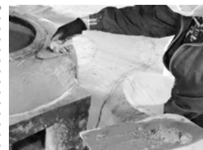
左官技法による修理

今回、令和3年1月から2月にかけて、かまどと周囲のたたき土間の一部を修理しました。かまどはひび割れなど損傷している部分をいったん崩してから塗り直し、たたき土間も傷んでいる部分を中心に、伝統的な左官の技術により施工しました。