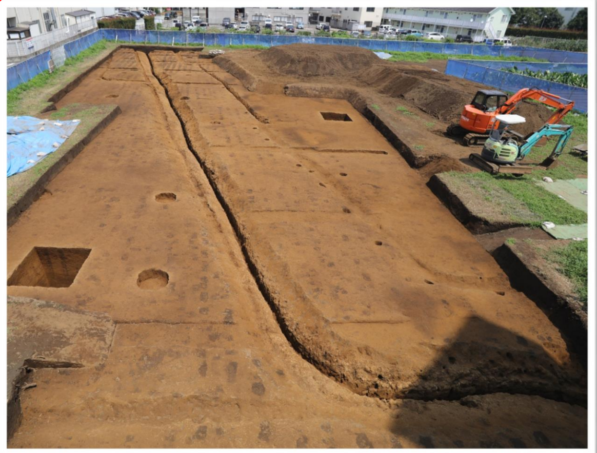
調査区を南北に縦断する溝跡