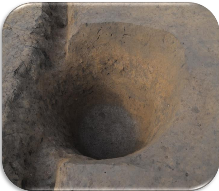
検出された縄文時代の陥し穴