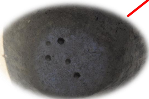
穴底に残る杭の跡