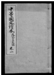
中野園文讀本 巻一