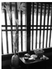
月見の展示(過去の様子)

供え物とともにススキを飾りますが、昔は朝霞市内でも野原などでススキは容易に手に入ったもので、この時季に咲いている野の花も添えて飾ります。大きな徳利などを使って、十五夜には5の数、十三夜には3の数に合わせてススキを飾ります。月見の供え物は、十