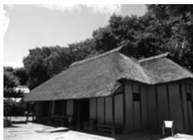
夏の青空と旧高橋家住宅(主屋)

職員などが、調査や広報のために今まで撮影してきた写真の中から、初夏から晩夏にかけての写真を選んで展示しています。季節の移り変わりを、色とりどりの写真でお楽しみください。