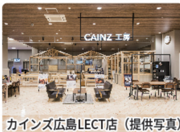
カインズ広島LECT店 (提供写真)