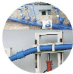
上水道用高性能 ポリエチレン管 「エスロハイパー」