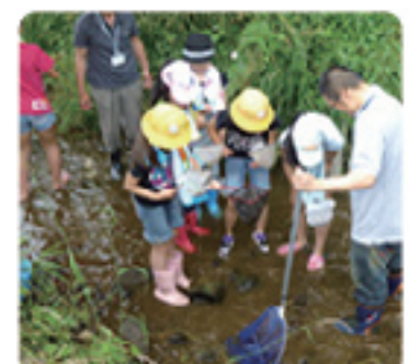
黒目川リバーウォーク