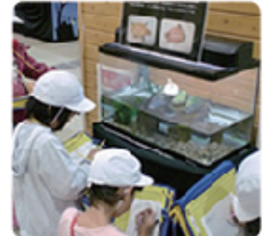
環境モニタリング 全て参考写真

地域コミュニティの活性化を目指してつくられた街の各エリアでは、多世代が参加できる生き物や植物等を観察するイベントや地産地消マルシェの開催を予定しています。