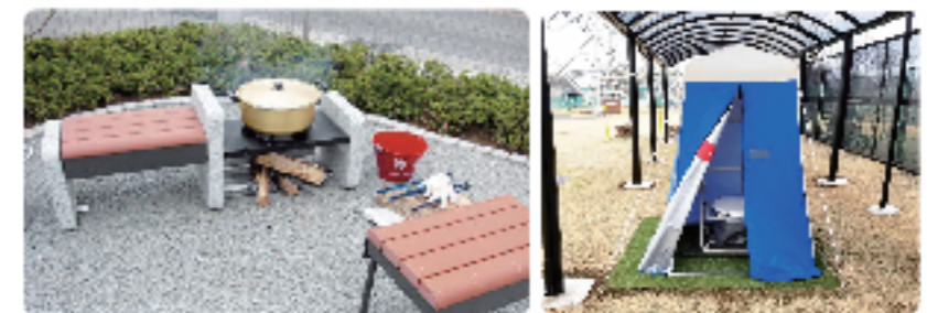
「かまどベンチ」「マンホールトイレ」の 実演や体験