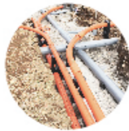
電線共同溝 「C.C.BOX 管路システム」