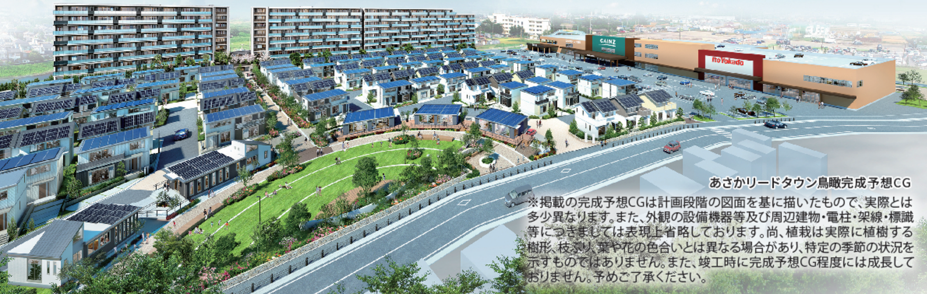
あさかリードタウン鳥瞰完成予想CG

※掲載の完成予想CGは計画段階の図面を基に描いたもので、実際とは多少異なります。また、外観の設備機器等及び周辺建物・電柱・架線・標識等につきましては表現上省略しております。尚、植栽は実際に植樹する樹形、枝ぶり、葉や花の色合いとは異なる場合があります。特定の季節の状況を示すものではありません。また、竣工時に完成予想CG程度には成長しておりません。予めご了承ください。