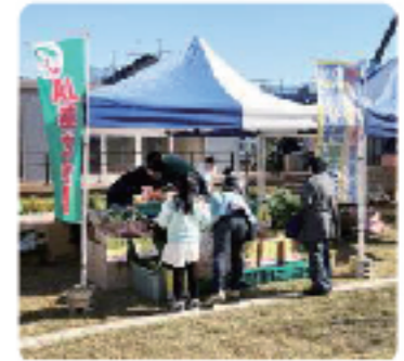
JAあさか野 地産地消販売