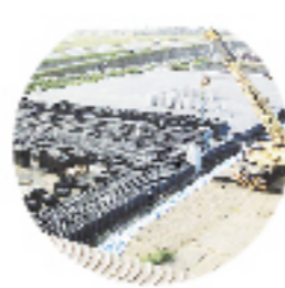
雨水貯留材 「クロスウェーブ」 全て参考写真