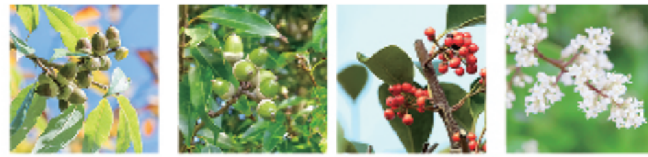
アラカシ シラカシ モチノキ ネズミモチ all image