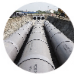
雨水貯留管 「エスロンRCP」