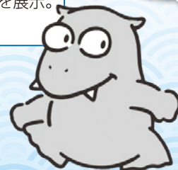
化石博物館、地球回廊キャラクター デスモくん