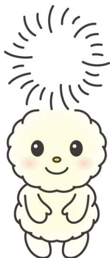
朝霞市キャラクター ぼぼたん