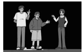
原画：(株)五藤高額研究所