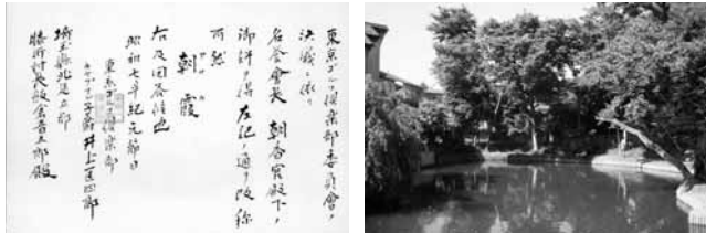
町名改称許可書(市指定文化財)