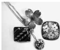
(写真は作品のイメージです。)

申込方法／4月12日(火)午後4時まで、電話または西朝霞公民館窓口で受け付けます。