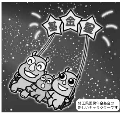
埼玉県国民年金基金の新しいキャラクターです

〒351-0005 朝霞市根岸台4-11-12 http://shiminso.jp