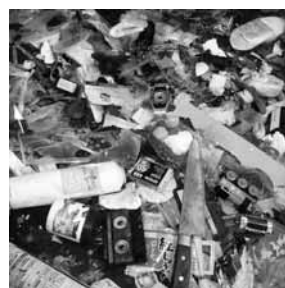
プラスチック資源に混ざる燃やせないごみ

※食品トレイ類はできるだけスパーなどの店頭回収をご利用くださるようお願いいたします。