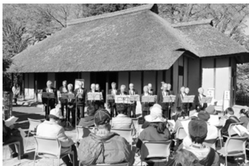
朝霞市指定無形文化財「根岸野謡」披露

ボランティアの方を中心に風車・竹とんぼづくり体験をはじめとしたさまざまなイベントが行われたほか、朝霞市指定無形文化財「根岸野謡」を保存会の方に披露していただきました。お昼には敷地内の畑で収穫された野菜を使ったけんちん汁が振る舞われ、清々しい秋晴れの下、実りの秋を楽しくお祝いしました。