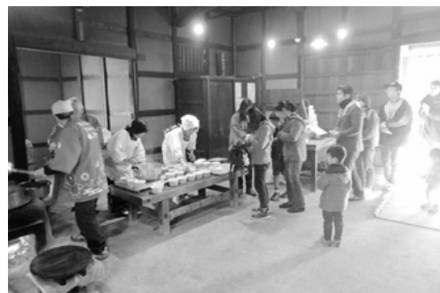
主屋内でのけんちん汁配布の様子