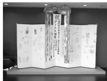
ぼぼたんが描き込まれた屏風