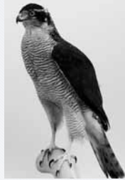
オオタカ(剥製) 埼玉県立自然の博物館蔵

今回の企画展では、鷹狩りとはどのようなことをするのかをご紹介しますとともに、鷹場となった朝霞の村々の実態を、市内に残された古文書を中心にひもといてみたいと思います。