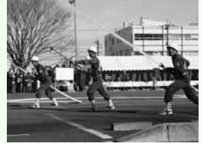
写真は前年の様子