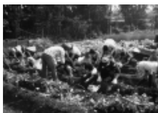
◀昨年度さつまいも掘りの様子(10月)

旧高橋家住宅の畑でたくさんさつまいもがとれました。畑はボランティアの皆さんが丹精こめて管理してくれています。