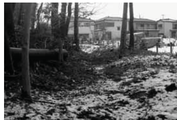
宮戸：当時の流れをしのぶ (朝霞市)