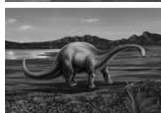
原画(株)五藤光学研究所