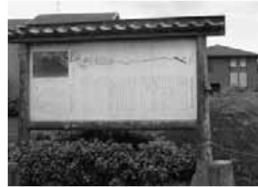
陣屋堀築堤 (新座市)

今回の展示では、清流の復活した新座市の野火止用水の現状、志木市および朝霞市では野火止用水の面影を紹介します。