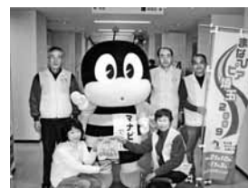
いっしょに記念撮影もどうぞ!