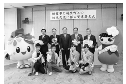
写真上段 左から野本市議会議長、富岡市長、上田知事、新井町長、新井町議会議長 下段 左から彩夏祭の踊り子と越生町のうめ娘

式では市長と町長がそれぞれの市、町のイベントや観光等の魅力をPR。朝霞市は市制施行50周年のキャッチフレーズである「むさしのフロントあさか」や市のキャラクターの紹介、彩夏祭のよさこい鳴子踊りを披露しました!!最後には、朝霞市の彩夏祭グッズと越生町の特産品等を友好の証として交換しました。今後はさまざまな分野で交流を進めていきます。