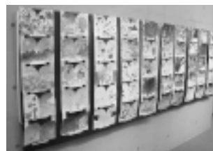
作品は9/5(土)～13日(日)に 展示します

時間 ／午前9時30分～11時30分、午後1時～4時 (正午～1時は昼休みのため部屋を閉めます) 会場 ／博物館 体験学習室 対象 ／どなたでも(おおよそ5才くらいからできます) 申込方法 ／当日直接会場へ(時間内入退場自由) お休み ／休館日と7/31(金)、8/5(水)、8/21(金)