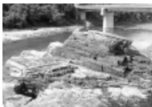
荒川・親鼻橋付近の こうれんせきへんがん 紅簾石片岩 (皆野町)

その中から、加工すれば宝石にもなるアメシストやトパズ、下の文字が浮かび上がって見えるウレキサイト(別名テレビ石)、紫外線で光る蛍光鉱物など不思議な石や珍しい石をたくさん展示しています。