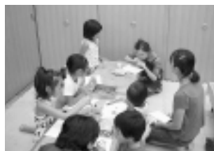
こんな感じで 楽しく制作しよう！

みんなの作品は、9月に博物館ギャラリーで展示します。今年の夏は、キミも「あーちすと」！