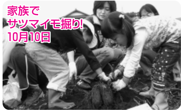
家族で サツマイモ掘り! 10月10日