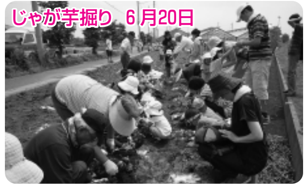
じゃが芋掘り 6月20日