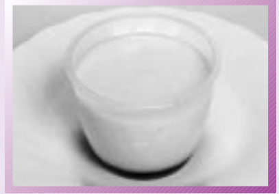
製品写真(ミャムミャムプリン)

朝霞ブランド認定品紹介コーナー第8回は、自家製たまごから作られる逸品「ミャムミャムプリン(パティスリー ロアレギューム)」です。