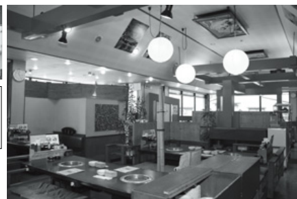
和風でモダンな店内でおいしい焼肉を堪能