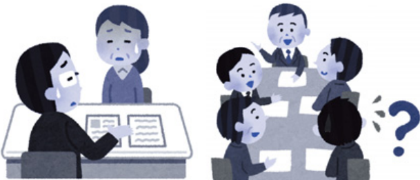
障害を理由に不動産の契約を断られた。