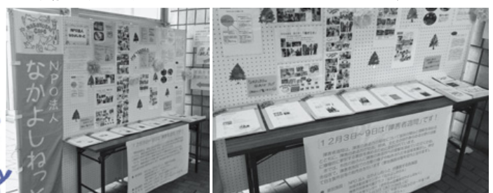
過去の展示の様子 (市役所1階市民ホールにて)