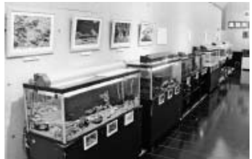
黒目川や新河岸川にいる魚たち。まるで水族館