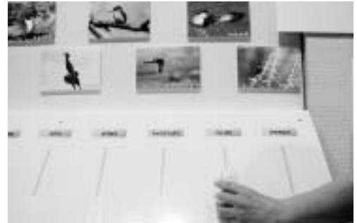
音声コードを読み取って鳥の声を聞いてみよう！