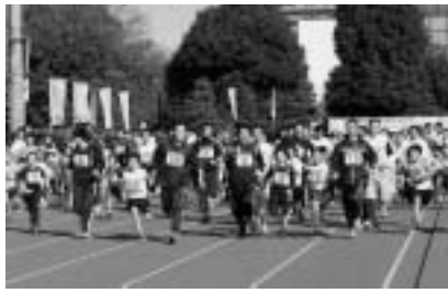
当日は陸上競技場周辺の道路が交通規制されます。近隣の皆様にはご迷惑をおかけしますが、ご理解とご協力をお願いします。

1 第47回朝霞市ロードレース大会 主催/朝霞市教育委員会 朝霞市体育協会 日時/11月23日(日) 開会式 午前8時30分 会場/中央公園陸上競技場 種目/ふれあい 1.0 km (小学1~3年生と保護者) 小学4・5年生 1.7 km 小学6年生 2.0 km 中学生 3.0 km 一般女子 5.0 km 壮年(40歳以上) 5.0 km 一般高校生以上 10 km